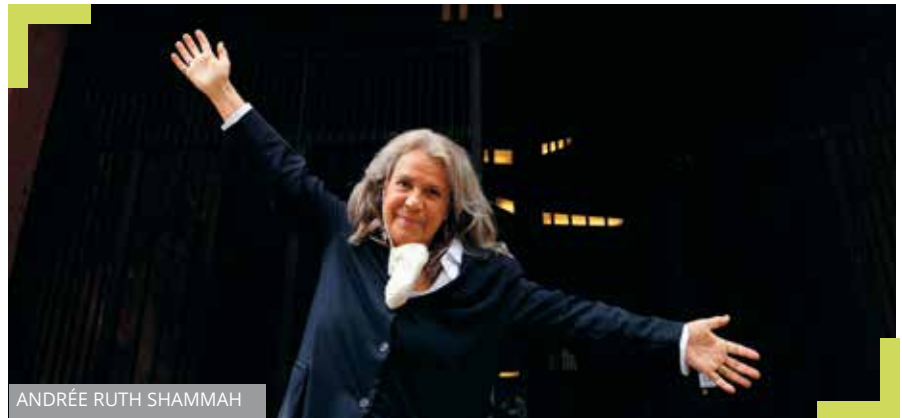
ANDRÉE RUTH SHAMMAH

Raggiunta da Strategie Amministrative, la regista ha ribadito la necessità di tornare nei teatri, considerando, provocatoriamente, che se “i musei e i teatri avessero potuto tenere aperto, avrebbero fornito un modo per nutrire lo spirito. Se ci fosse stato Strelher, avrebbe fatto la battuta che andando nei teatri si veniva vaccinati. Non voglio ovviamente sminuire il problema, anche perché sono una persona di 77 anni, con problemi di salute e che ha fatto di tutto per proteggersi, ma ritengo che l’uscita dal lockdown sarà durissima e, per uscire dalla comfort zone che abbiamo creato, ci può aiutare il teatro dal vivo, e non quello in streaming o via webinar”.